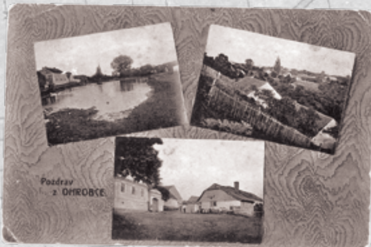
Velice stará pohlednice zachycující Ohrobec na třech fotkách - vypuštěný rybník, pohled z planin na Károuvě a sdružení lidí před statkem rodiny Trojánků, náves neměla tehdy ještě silnici, což je dnes nepředstavitelné. Vydáno nákladem J. Boháčka, nakladatelstvím A. F. Warner ve Štěchovicích.