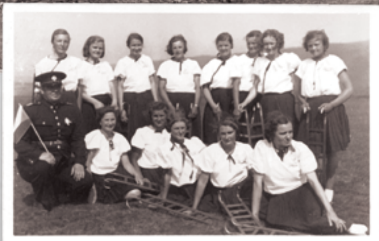
Ohrobecké členky České obce sokolské na okresním cvičení v Okrouhlu, foceno 6. července 1937. Sokolu zbývá už jen pár let života, zakázán byl 12. dubna 1941.