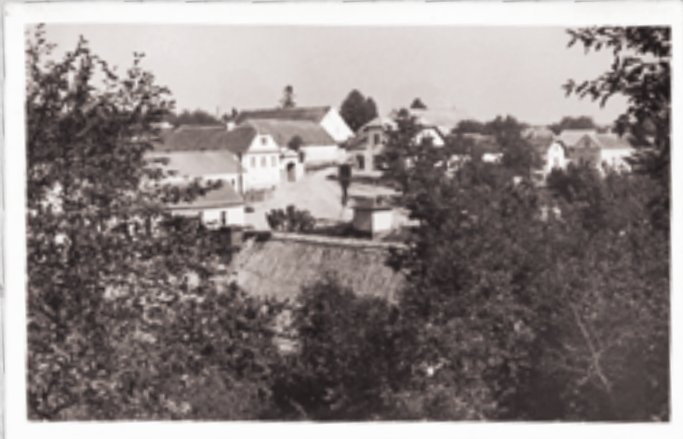
Pohled od dnešního obchodu U Kapitána, střed obce s úzkým průjezdem mezi dvěma statky, vlevo restaurace U Trojánků. Rok neznámý.