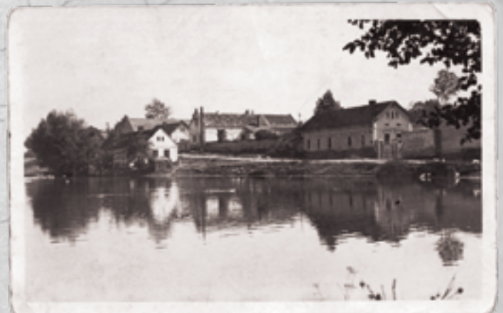
Rybníky v centru Ohrobcu bývaly chloubou obce, takto je zachytil fotograf na staré pohlednici.