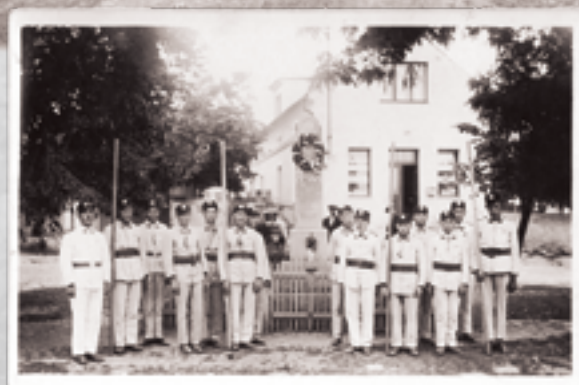
Sbor ohrobeckých hasičů nastoupených ve slavnostních uniformách na slavnostech ve Zvoli, napravo od kostela. Zřejmě třicátá léta.