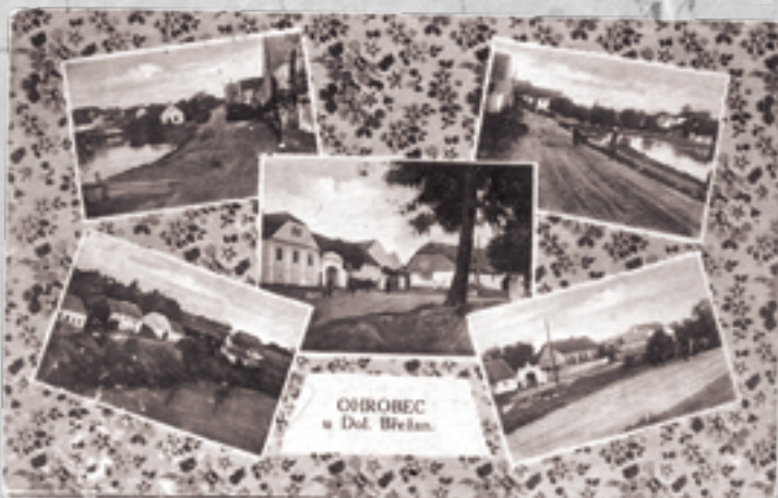
Pohlednice orazítkovaná poštou Dolní Břežany 11. června 1929. Fotil Josef Dvořák z Košíř, vydalo Nakl. Kopeleta, hostinský v Ohrobcu.