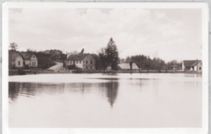
Tato fotografie zachycuje hráz rybníka v Ohrobcu, vlevo je patrná slavná zatáčka směřující do Zvole a hospoda.

Máte doma také staré pohlednice a fotky? Půjčte nám je! Pošlete nám e-mail na podatelna@ohrobec.cz , rádi se pro ně zastavíme!