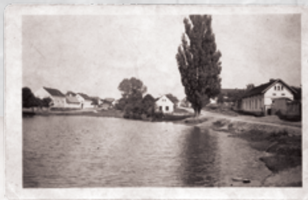
Klasický pohled na Ohrobec z hráze rybníka. Všimněte si tehdejší dominanty, vzrostlého stromu před statkem rodiny Zierových.

Ohrobec na pohlednici zřejmě z počátku šedesátých let, fotil M. Krob, pohlednice tehdy stála 90 haléřů.