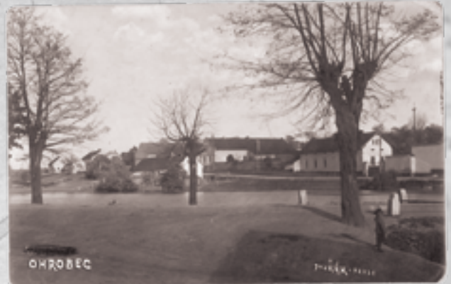
Stará pohlednice z daveleského ateliéru Dvořák, Ohrobec je zde zachycen z netradičního úhlu pohledu přes rybník